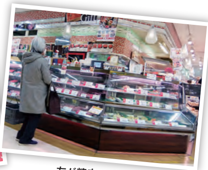
左が精肉コーナー 右は奥まで総菜コーナー