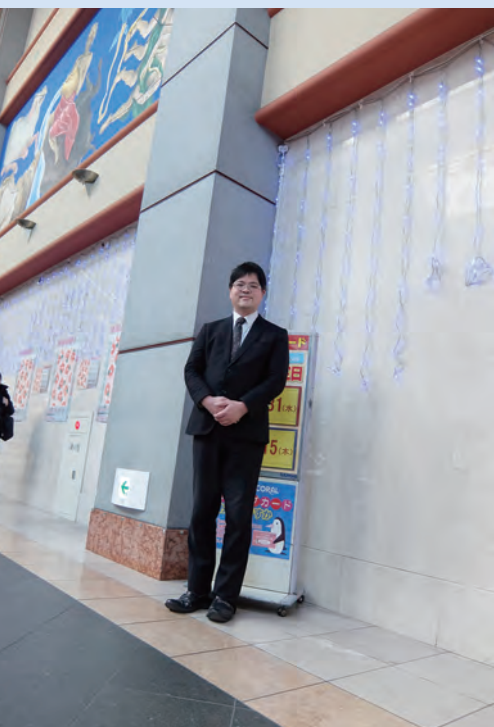
このスペースが最高なんです

に参加できないかという依頼があり、三鷹コラルで演奏したのが最初のご縁でした。演奏したのは、三鷹駅から連なる2階の入口のエントランスホールで、4階までの吹き抜けの空間によってハンドベルの音色がとても美しく響き渡る最高の場所でした。さらに団員からは、三鷹コラルの方々から大変温かくしてくれて感激した声もあり、以来「三鷹コラルでなら」という条件で参加をしています。そして、このコラルでの演奏を聴いていた西武百貨店の方が渋谷西武でも演奏して欲しいと言われ、昨年と一昨年に演奏しに行きました。現在、「木曾三川」というお酒を造っている内藤醸造株式会社に勤務していますが、表参道に店舗があり、この地域でもハンドベルを鳴らしたいと思っています。ハンドベルの魅力を広めていくことがクリスタルハンドベルクワイヤを結成した目的ですが、新たな地域でも出来そうなのでうれしく思っています。